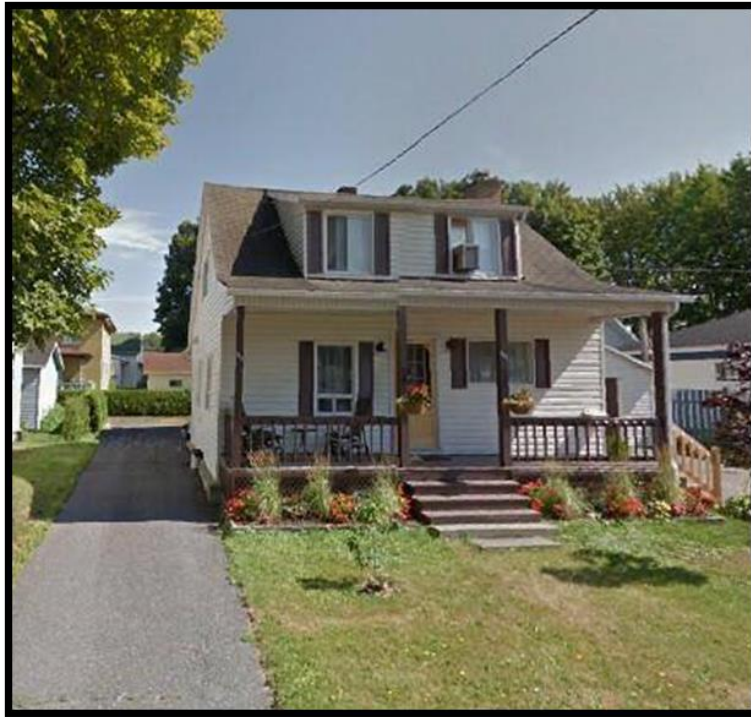
Au 349- 351 avenue St-Georges