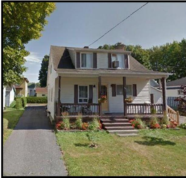
Au 349- 351 avenue St-Georges