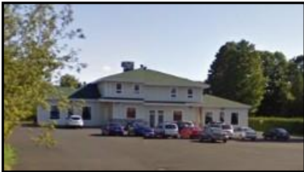
Centre Energym 814 Notre-Dame sud