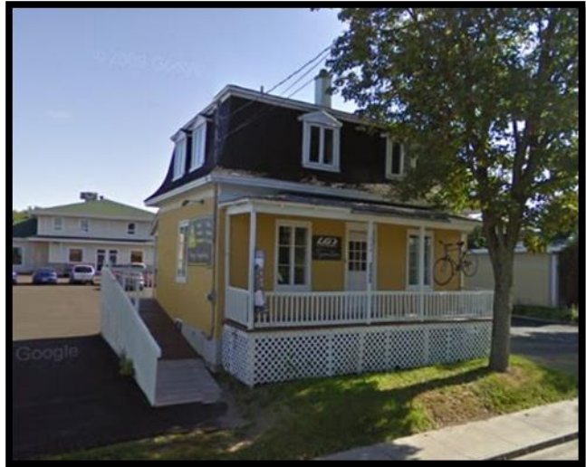
804 Notre-Dame sud maison de Wilfrid Labbé qui fut démolie en 2014