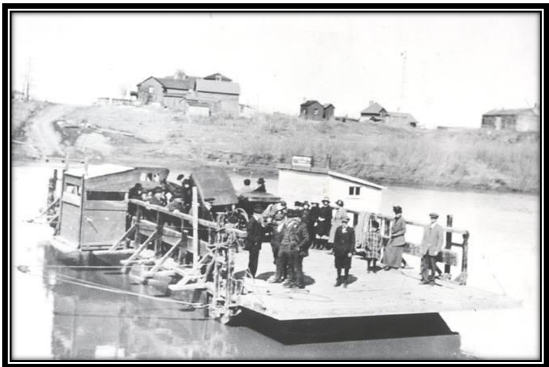
Ce bac a été en utilisation au début des années 1900.

Malheureusement, ce gros projet devint immédiatement un échec car lors de sa construction, le pont s'est écroulé et quatre hommes sont morts écrasés.