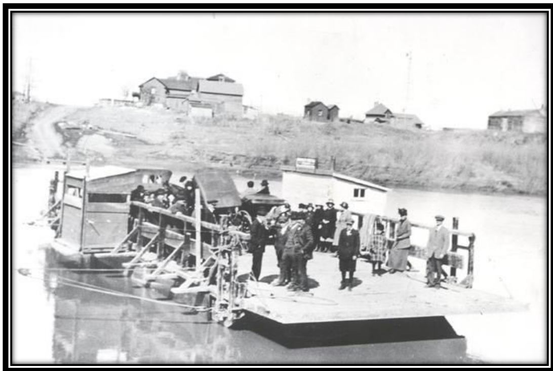
Ce bac a été en utilisation au début des années 1900.

Malheureusement, ce gros projet devint immédiatement un échec car lors de sa construction, le pont s'est écroulé et quatre hommes sont morts écrasés.