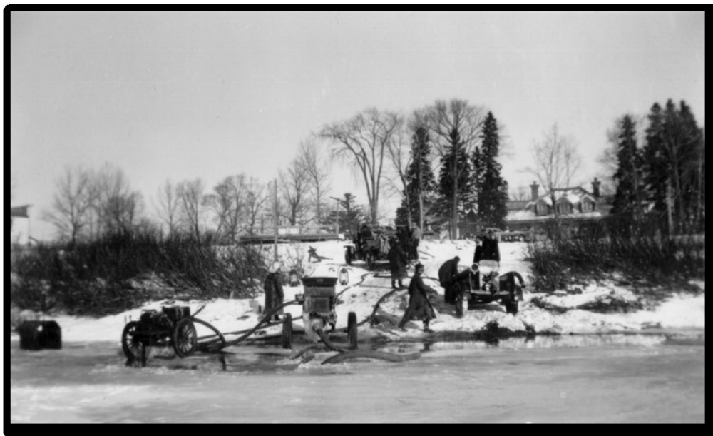
Photo prise en 1957, nous y apercevons le Manoir en arrière-plan