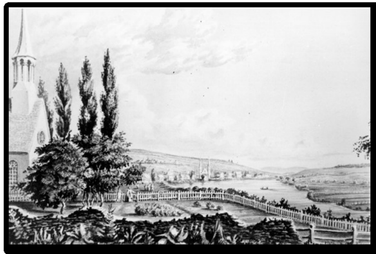
Aquarelle réalisée entre 1832 et 1845 sur les ruines du Manoir