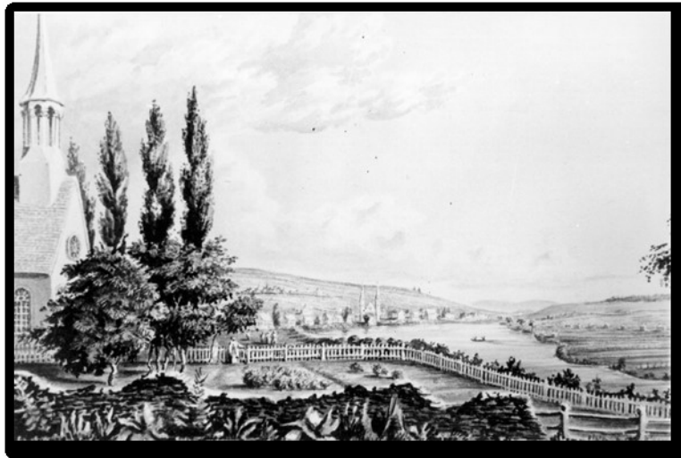
Aquarelle réalisée entre 1832 et 1845 sur les ruines du Manoir