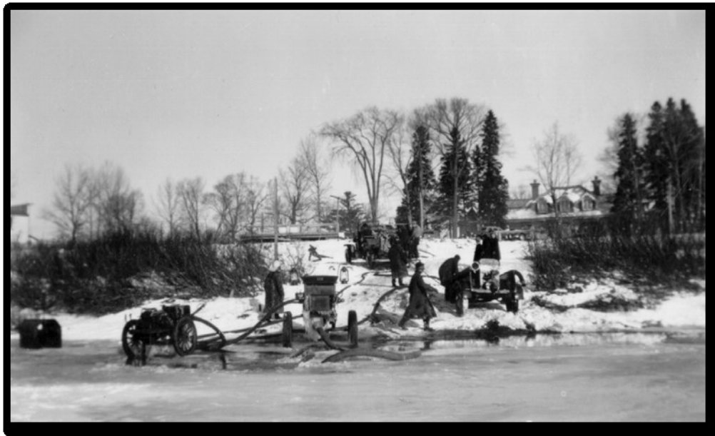
Photo prise en 1957, nous y apercevons le Manoir en arrière-plan