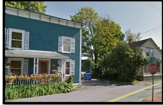
au coin Carette et St-Georges

Plusieurs autres petits commerces ont existé dans ce secteur, quincaillerie, barbier, forge, restaurant, etc... Les gens de Ste-Marie ont toujours été débrouillards pour gagner leur vie.