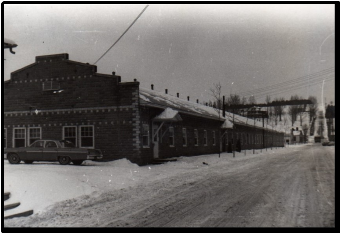
Les Boîtes Excelsior Ltée sur l'avenue St-Jean