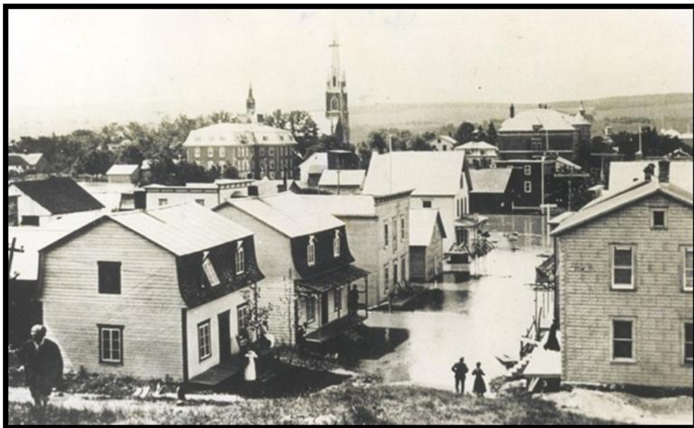
Le bâtiment bas dans la rue : La petite boulangerie

Dès son arrivée, Arcade Vachon est devenu très intéressé par la petite boulangerie inoccupée de Cléophas Leblond et en prit possession finalement en octobre 1923.