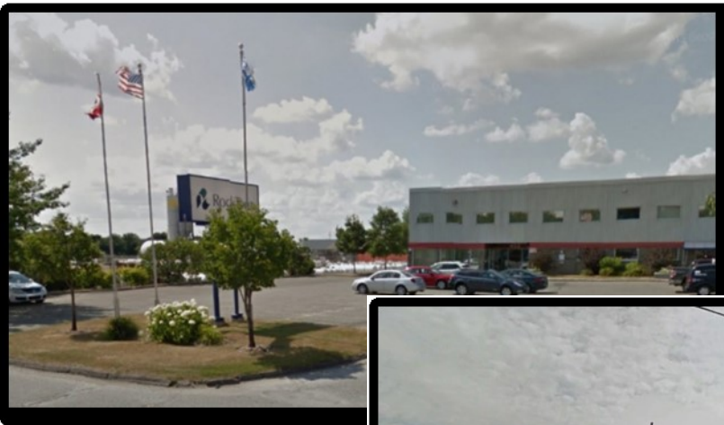
L'usine Rocktenn (une partie de Westrock) est située dans le Parc Industriel de Ste- Marie

Malgré tous ces changements et malgré aussi le fait que "les affaires sont les affaires", il est toujours triste de voir des américains devenir propriétaires de nos industries. Cependant, c'est quand même une fierté pour nous, gens de Ste-Marie, de réaliser que cette industrie (née en 1938) est encore située à Ste-Marie dans notre Parc Industriel.